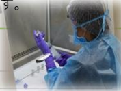
抗悪性腫瘍薬調製件数

抗がん剤の投与量に間違いが無いか確認し、 薬剤師が抗がん剤の特性に合わせて、安全かつ 正確に無菌調整を行っています。